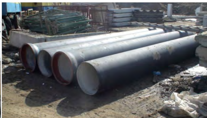
Строительство коммуникаций Ду 100-300 мм для Торгового центра «Семёновский» г. Москва.